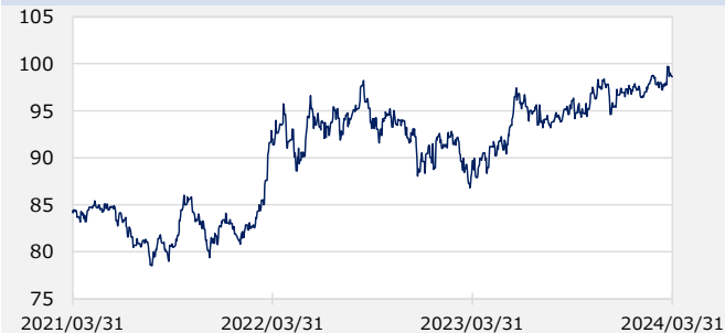
円/オーストラリアドル（円）