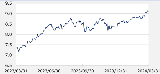
円/メキシコペソ（円）