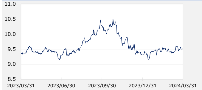
FTSE WGBIメキシコ国債 最終利回り（%）