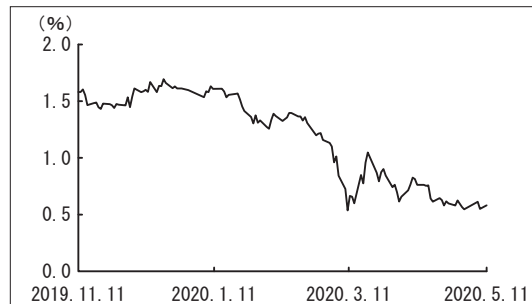
カナダ10年国債利回りの推移

カナダドル円相場は、原油相場の大幅下落やカナダ銀行（中央銀行）による利下げの実施などを背景に、下落する展開となりました。