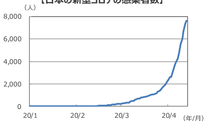
【日本の新型コロナの感染者数】