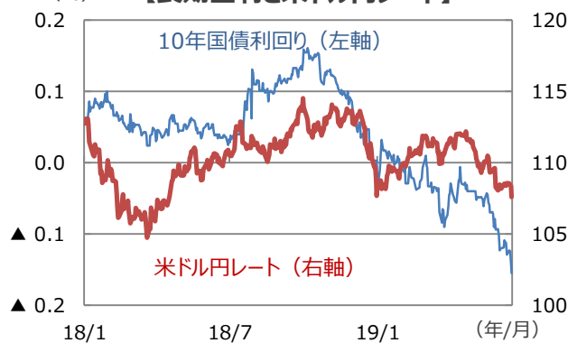
【長期金利と米ドル円レート】（円/米ドル）