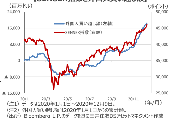
【SENSEX指数と外国人買い越し額】