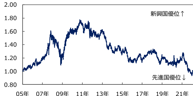
(ポイント) 【新興国株の対先進国株相対パフォーマンス】

(注) データは2005年1月3日～2022年1月25日。 2005年1月3日 = 1.00。MSCI配当込みドルベースでの比較。 (出所) Bloombergのデータを基に三井住友DSアセットマネジメント作成