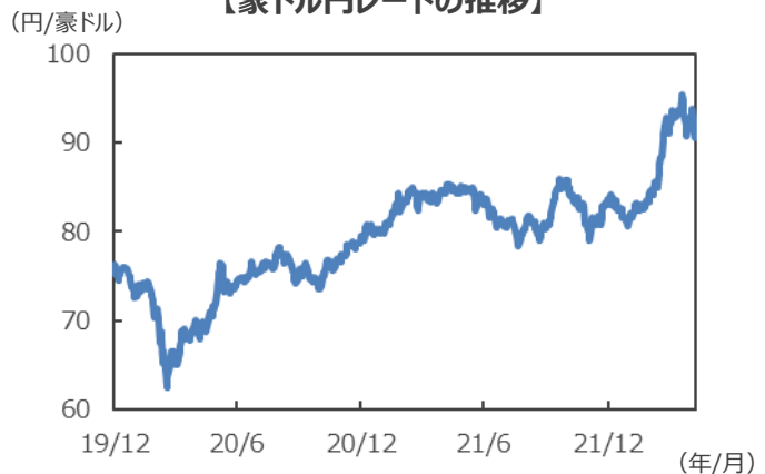
【豪ドル円レートの推移】