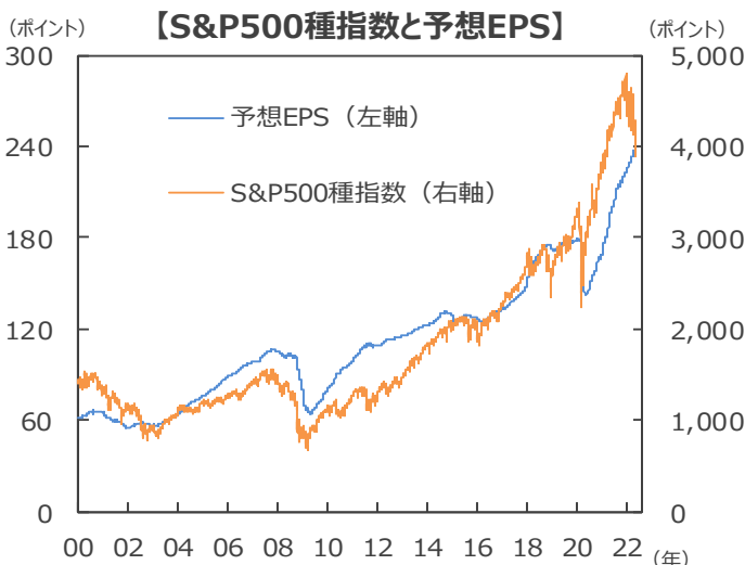
(注) データは2000年1月3月～2022年5月27日。予想EPSは12カ月先予想利益ベース。予想はFactSet。 (出所) FactSetのデータを基に三井住友DSアセットマネジメント作成