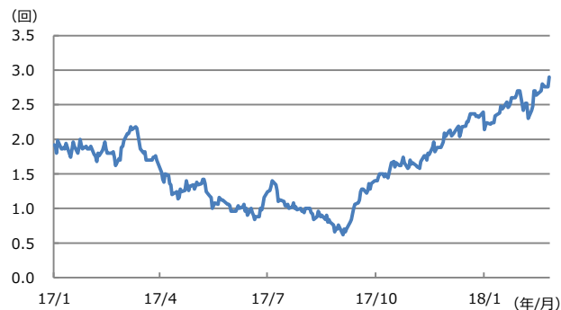
【図表2：FF金利先物市場が織り込む米利上げ回数】

(注) データは2017年1月3日から2018年2月27日。利上げ回数は2018年の利上げ回数。