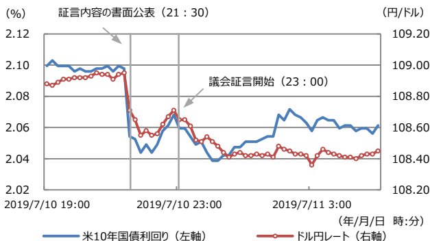
【図表1：米10年国債利回りとドル円の推移】

(注) データは2019年7月10日19:00から7月11日05:00。日時は日本時間。 (出所) Bloomberg L.P.のデータを基に三井住友DSアセットマネジメント作成