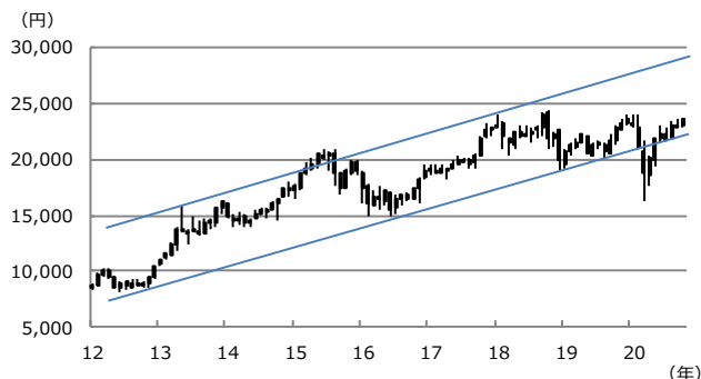
【図表1：日経平均株価の上昇トレンド】

(注) データは2012年1月から2020年10月。ローソク足は月足。ただし2020年10月は9日まで。上値抵抗線は2013年5月高値と2018年1月高値を結んだ線。下値支持線は2012年10月安値と2016年6月安値を結んだ線。