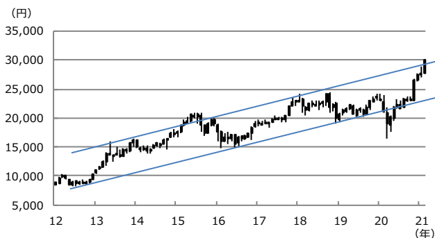
【図表1：日経平均株価の上昇トレンド】

(注) データは2012年1月から2021年2月。ローソク足は月足。2021年2月は15日まで。上値抵抗線は2013年5月高値と2018年1月高値を結んだ線。下値支持線は2012年10月安値と2016年6月安値を結んだ線。